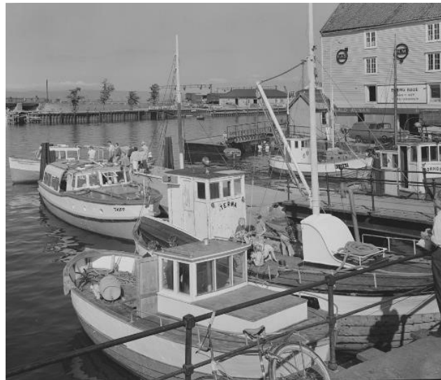
Ravnkloa 1964: Kilde Nasjonalbibliotekets bildesamling.

Mange vil nok kjenne igjen omgivelsene fra Ravnkloa selv om flere ting har forandret seg siden 1964. Munkholmbåten «Tripp» ligger til kai sammen med fiskebåtene, og i bakgrunnen skimter vi fløtmannen ved Fosenkaia.