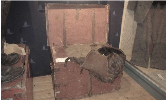
Lofotkiste