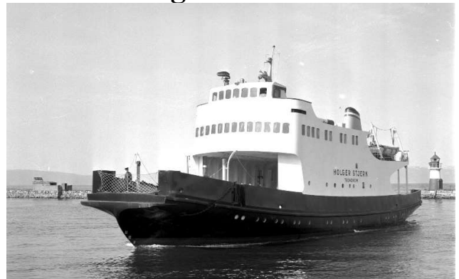
Holger Stjern på vei inn til Skansen.

Etter nesten 40 års fravær er ferga M/F Holger Stjern på tur tilbake til Trøndelag. Som den andre ferga kontrahert av det opprinnelige selskapet A/S Fosenferja (stiftet i 1955), gikk M/F Holger Stjern på strekningen Skansen til Vanvikan fra 1958 til fram til 1980. Den ble da solgt og endte etter kort tid i Finland hvor den siden har gått i rutefart som M/F Pielinen på innsjøen med samme navn. Våren 2020 ble ferga lagt ut for salg, og en gruppe enkeltpersoner med tilknytning til Kystlaget Trondhjem kjøpte ferga i august.