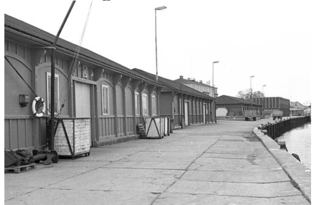
Skurene på Fosenkaia 1969.

Skurene på Fosenkaia har forandret seg lite på 50 år. Selv om bruken og innholdet i skurene på mange måter er ny, har området beholdt sin autentiske karakter takket være kystlagets virksomhet. Fosenkaia er stedet der folk fremdeles kan oppleve båter og lagerskur, kjenne lukta av tjære, og høre lyden av smia eller snekkerverkstedet, og kanskje en nyrestaurert båtmotor som startes opp.