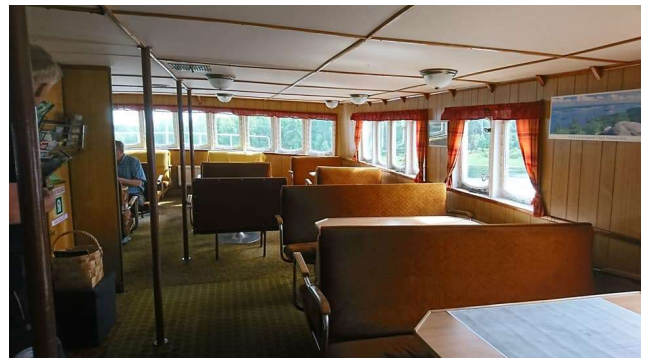
Fra oversalongen på M/F Holger Stjern

I de påfølgende dagene har ferga blitt flyttet fra byen Lieksa til byen Savonlinna i Karelen der den skal ha et verkstedopphold før seilasen hjem. Målet er å bringe ferga tilbake til Trondheim som et museumsfartøy som også kan brukes til undervisningsformål. M/F Holger Stjern er en viktig del av vår samferdselshistorie, sjøfartshistorie og lokalhistorie i Trøndelag og vil være et viktig flytende kulturminne for ikke bare Trondheim, men for hele Trøndelag.